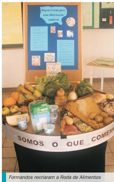
Formandos recriaram a Roda de Alimentos

Este tema de vida foi trabalhado pela equipa pedagógica e pelos formandos começando por realizar um inquérito a alguns cidadãos trofenses, para averiguar quais doenças sobre as quais gostariam de estar mais bem informados. Depois de procederem à análise dos resultados, os formandos optaram por abordar doenças como o cancro, a hepatite, a sida, as doenças