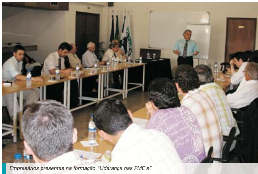
Empresários presentes na formação “Liderança nas PME’s”