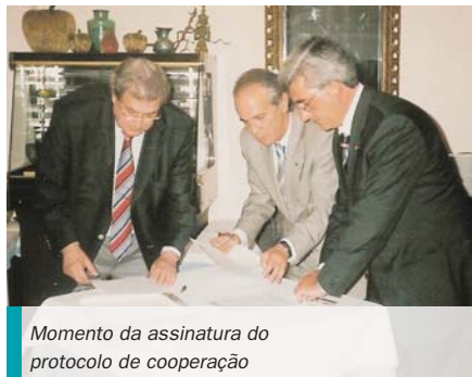
Momento da assinatura do protocolo de cooperação

Este acordo prevê a criação de um grupo de trabalho, que funcionará como Comissão Instaladora, constituída por representantes das três entidades, que terá como objectivo estruturar todo o projecto quer promovendo a identificação das necessidades formativas, quer encontrando o enquadramento legal que dará corpo a esta estrutura.