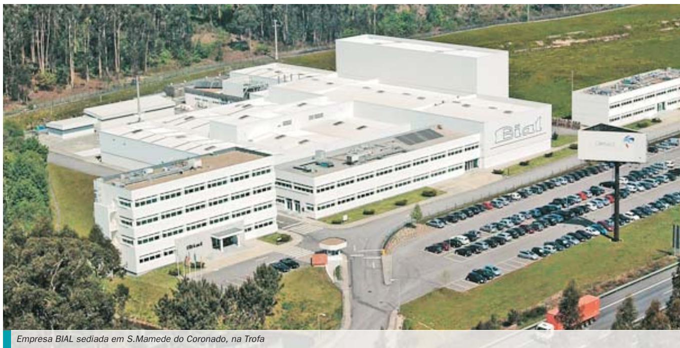
Empresa BIAL sediada em S.Mamede do Coronado, na Trofa

I&D, particularmente o lançamento no mercado mundial dos projectos que estão em fase mais adiantada, um antiepiléptico e um anti-parkinsoniano. O ciclo de inovação na indústria farmacêutica é um ciclo muito longo. Em média desde que se começa a sintetizar uma nova molécula até à sua entrada no mercado passam cerca de 13 anos. A previsível introdução no mercado dos nossos próprios produtos será a concretização de um sonho e o culminar de muitos anos de trabalho, de muita energia e de muita dedicação de toda a equipa Bial.