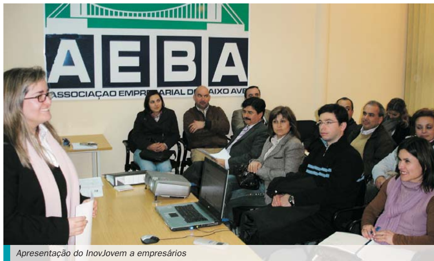
Apresentação do InovJovem a empresários

Em Setembro, está previsto o arranque da formação em sala do curso de Gestão de Recursos Humanos, Higiene e Segurança no Trabalho e posteriormente, no final do ano, do curso de Inovação e Qualidade.✘