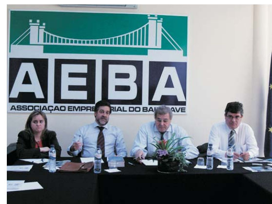
Sessão de Informação sobre a S.P.A.

→ Informar os empresários, esclarecer todas as dúvidas, analisar cada caso em particular e permitir auferir de um desconto até 30 por cento no próximo pagamento foi o objectivo da sessão de informação/debate sobre a Sociedade Portuguesa de Autores (SPA) que a AEBA – Associação Empresarial do Baixo Ave realizou na sua sede, no passado dia 19 de Maio.