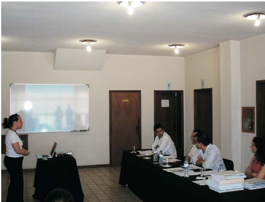
Formanda do Curso Técnico Superior de Higiene e Segurança na apresentação do trabalho prático

→ Terminou com sucesso o curso de Técnico Superior de Segurança, Higiene e Saúde no Trabalho, promovido pela AEBA – Associação Empresarial do Baixo Ave, com o apoio do Centro de Emprego de Santo Tirso, no âmbito do FORDESQ – Formação de Activos Qualificados. Depois da formação em sala, que terminou a 28 de Março, 19 formandos iniciaram as 120 horas de formação prática em contexto de trabalho.