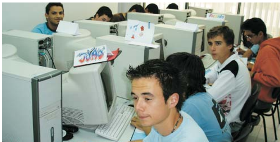
Formandos do curso de Electricidade nas Instalações

→ Os cursos de Educação Formação, na área da Metalomecânica e da Electricidade já arrancaram na AEBA. Durante cerca de um ano, 28 alunos vão frequentar estes dois cursos que, no final, lhes confere um certificado de equivalência ao 9º ano de escolaridade e uma qualificação profissional de nível II.